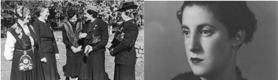
Pilar Primo de Rivera/ Alemania 1941