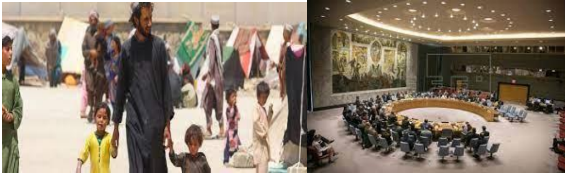
Ayuda de la ONU

Consejo de Seguridad una resolución que renueva y da fuerza al mandato de la misión política en el país. Ese mandato establece una relación con “todos los actores políticos relevantes y partes interesadas, incluyendo conforme sea necesario las autoridades relevantes”, lo que en la práctica significa con los talibanes, a los que la resolución no menciona por nombre.