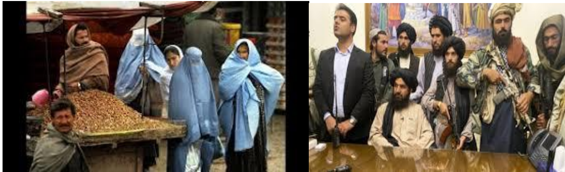
Nueva realidad de las mujeres